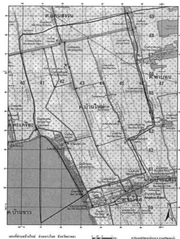
แผนที่องค์การบริหารส่วนตำบลบ้านใหม่ อำเภอรอนดง จังหวัดสงขลา