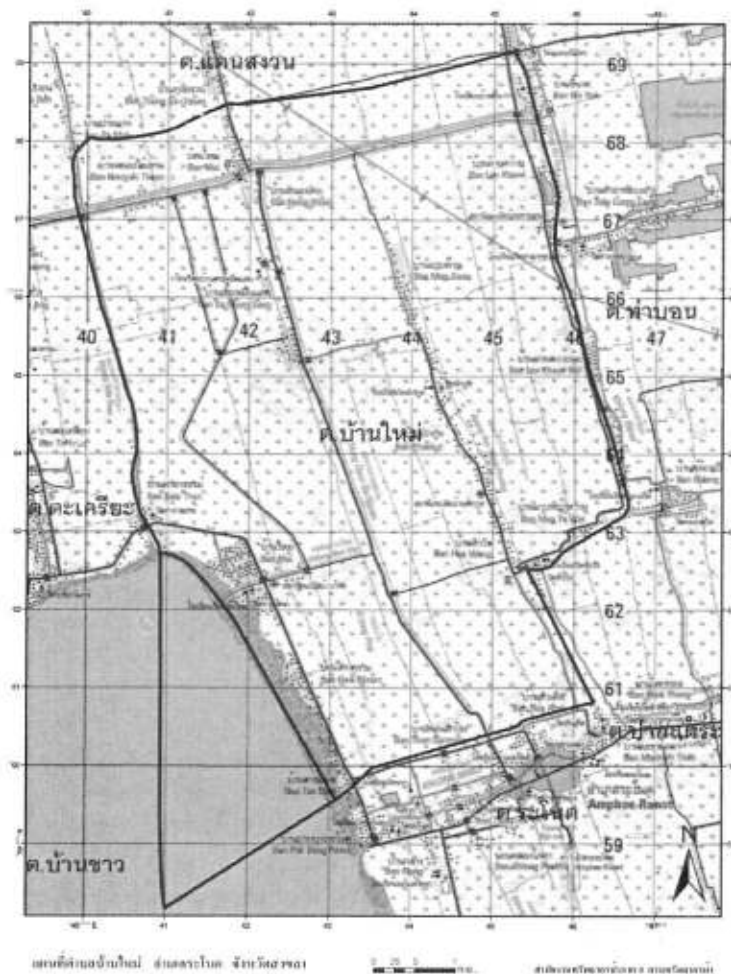
แผนที่องค์การบริหารส่วนตำบลบ้านใหม่ อำเภอระโนด จังหวัดสงขลา